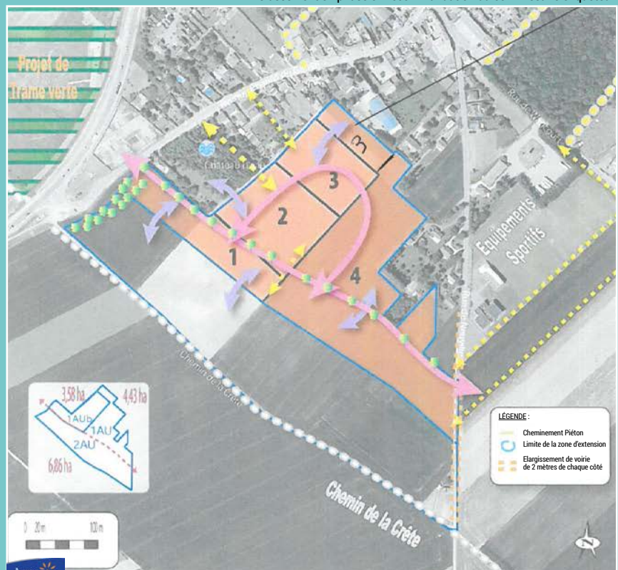
Orientations d'Aménagement « Zone Sud » après modification

Classement en phase 3. Recommandation du commissaire enquêteur.